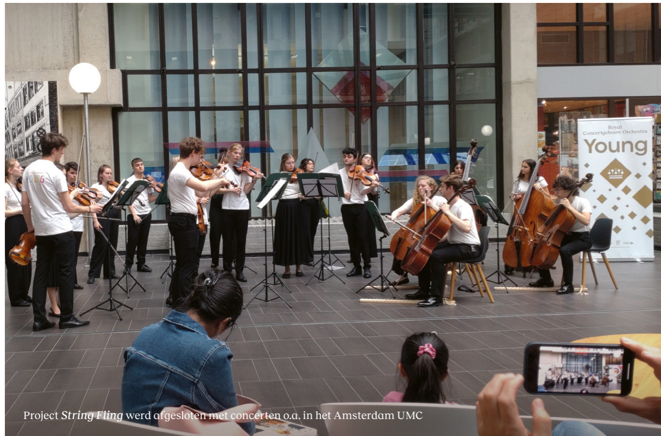
Project String Fling werd afgesloten met concerten o.a. in het Amsterdam UMC