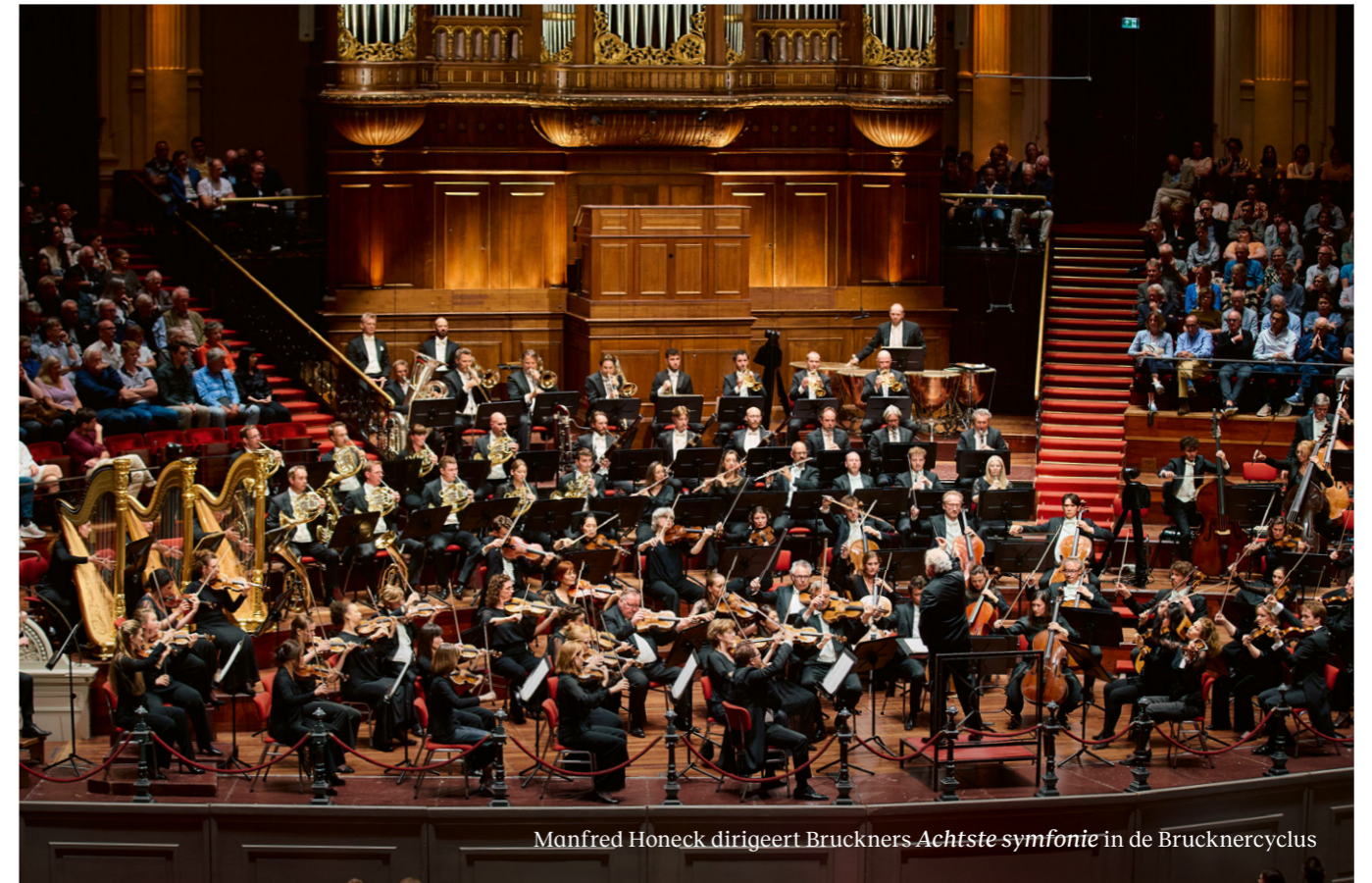
Manfred Honeck dirigeert Bruckners Achtste symfonie in de Brucknercyclus