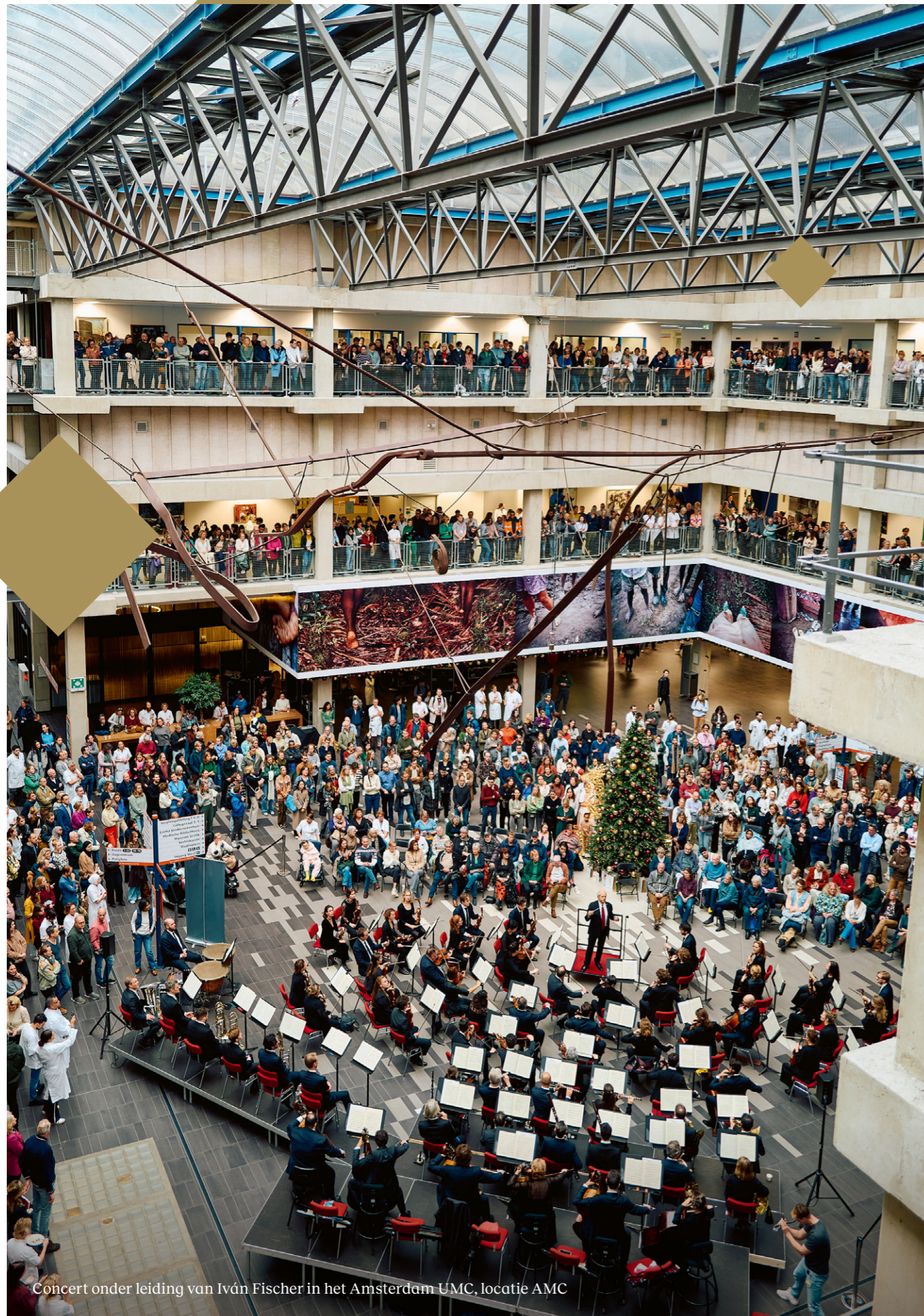
Concert onder leiding van Iván Fischer in het Amsterdam UMC, locatie AMC