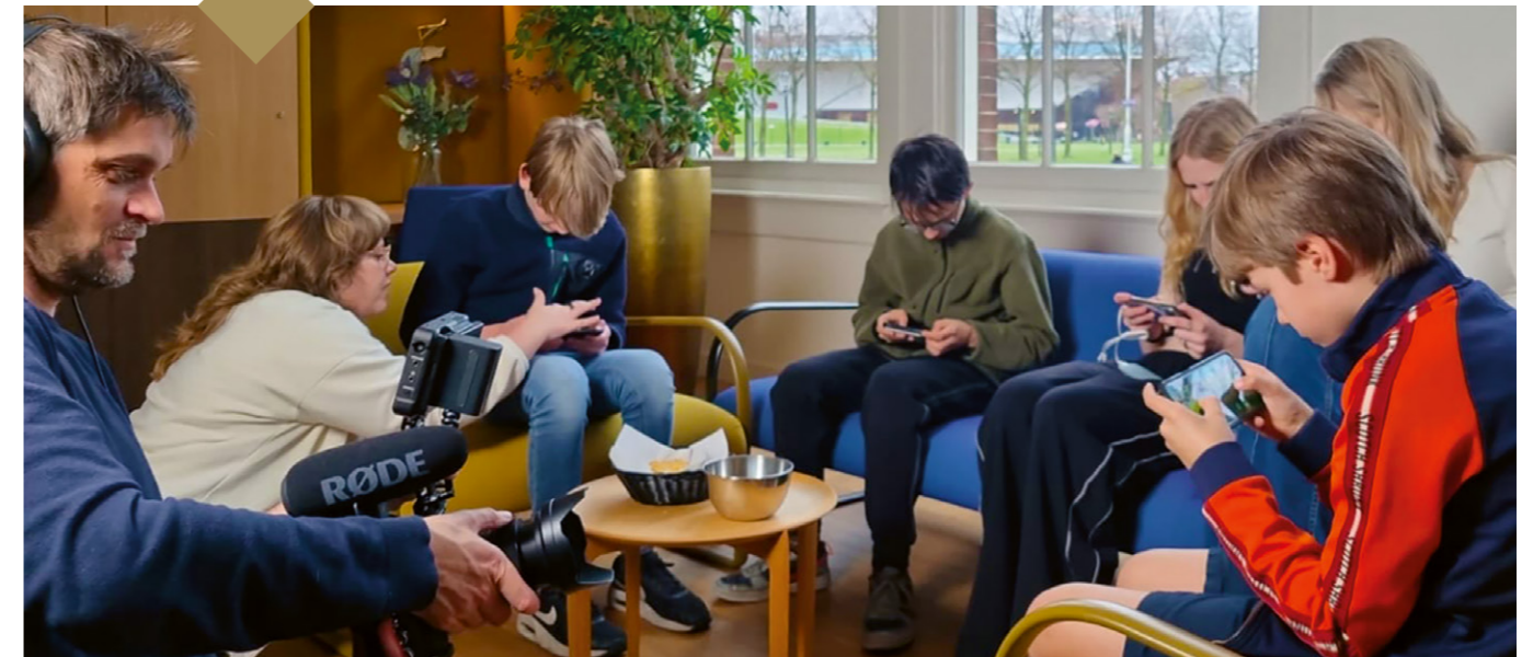
Het testen van de game. Meer dan vijftig jongeren van over de hele wereld hielpen met bedenken en ontwikkelen om de game zo mooi en spannend mogelijk te maken.

Final Score bestaat uit vijf werelden waarin spelers in principe oneindig kunnen spelen door nieuwe wapens in de vorm van muziekinstrumenten te vergaren en steeds meer punten te scoren. Zo kun je met een dwarsfluit vijanden bevriezen en werkt een kerkklok als schild. Onderweg kunnen spelers standbeelden van componisten tegenkomen en minigames doen, waarin ze bijvoorbeeld een melodie na moeten spelen of muzikale vragen beantwoorden. Ongemerkt krijgen spelers verhalen van componisten en muziekstukken mee in het spel. Zo klinkt na het verslaan van een eindbaas Fêtes van Debussy.