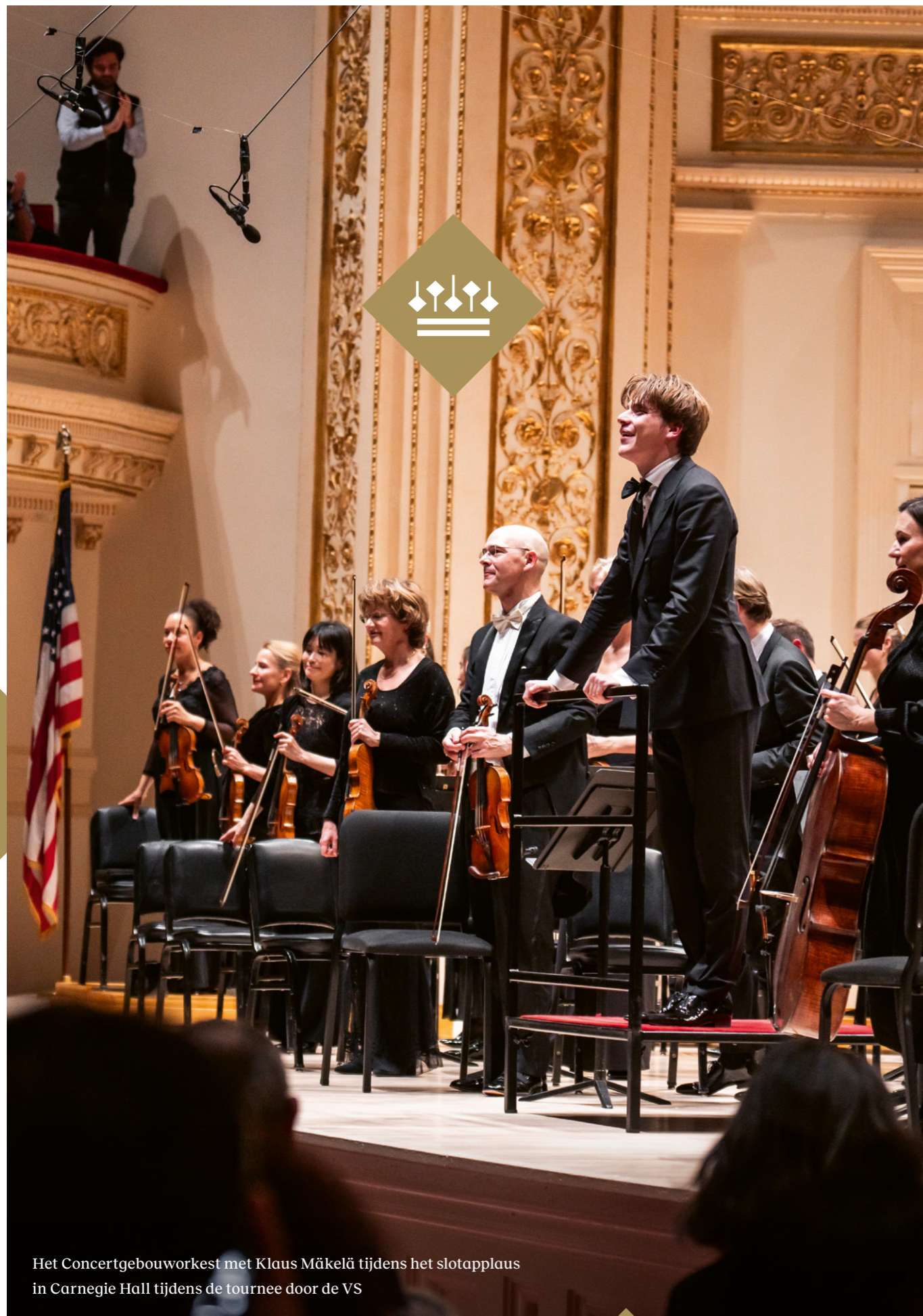
Het Concertgebouworkest met Klaus Mäkelä tijdens het slotapplaus in Carnegie Hall tijdens de tournee door de VS