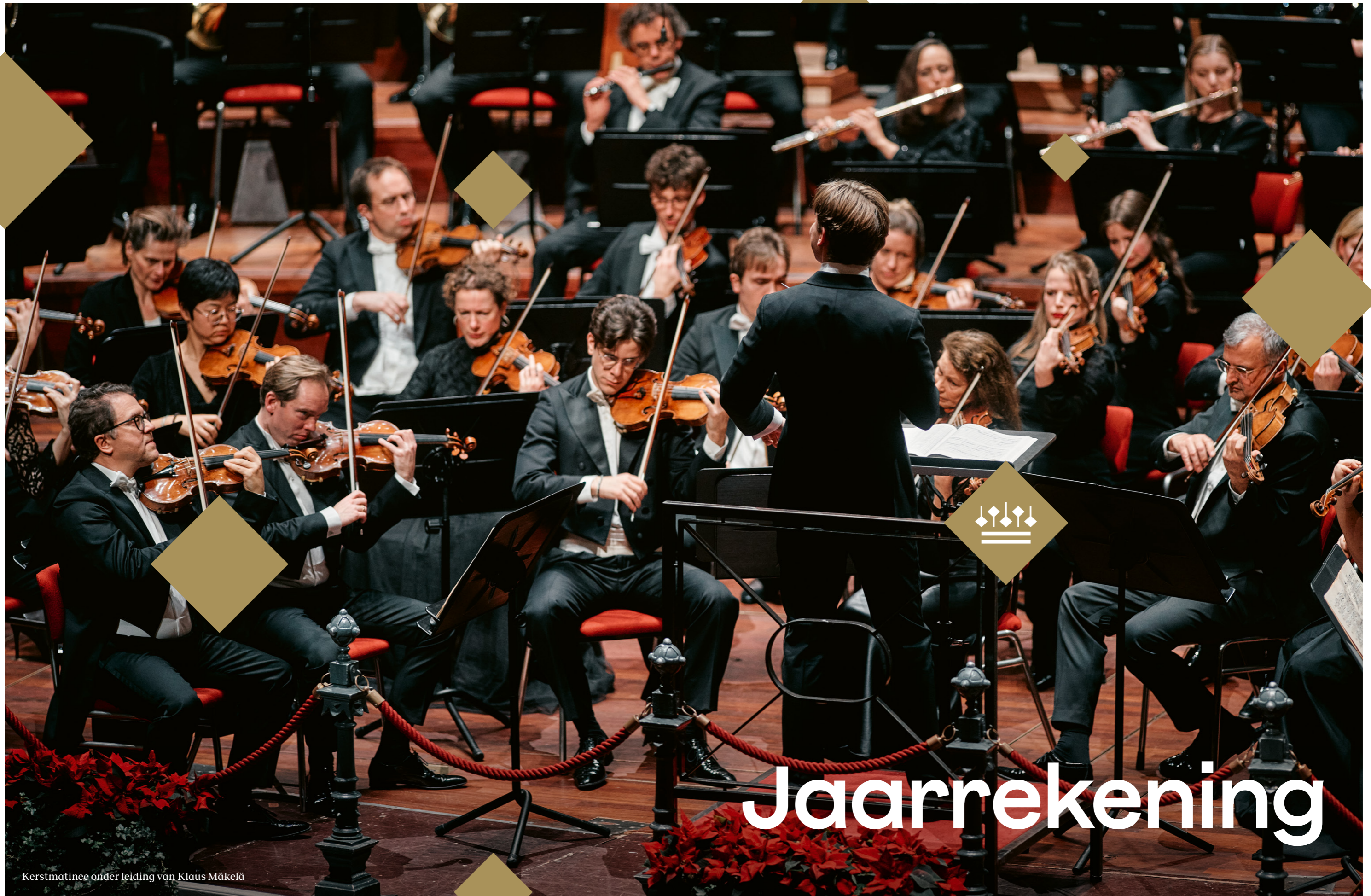
Kerstmatinee onder leiding van Klaus Mäkelä