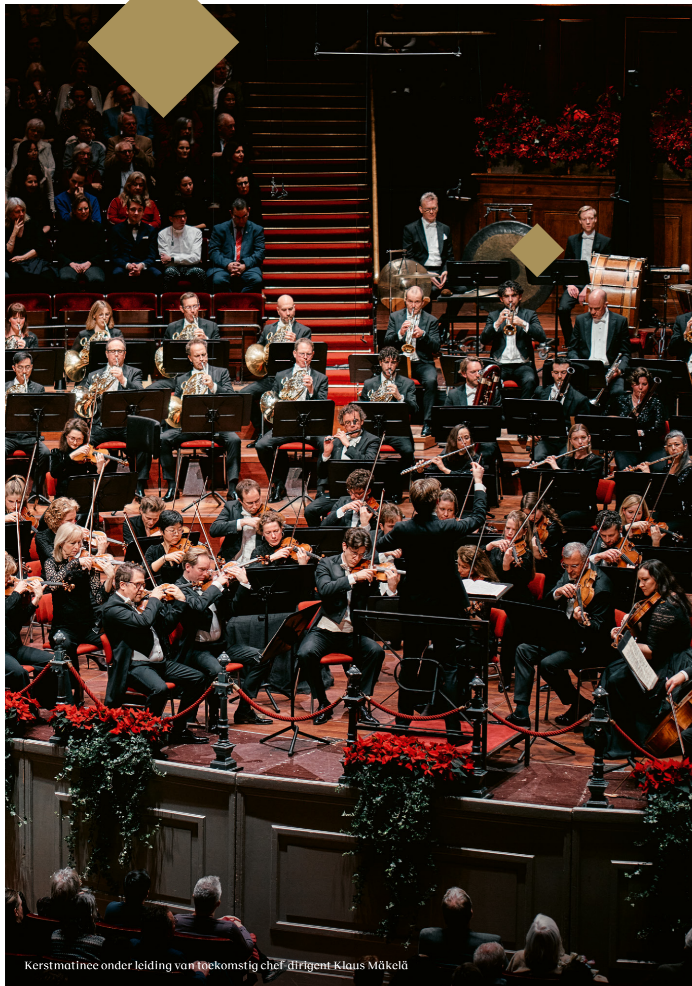
Kerstmatinee onder leiding van toekomstig chef-dirigent Klaus Mäkelä