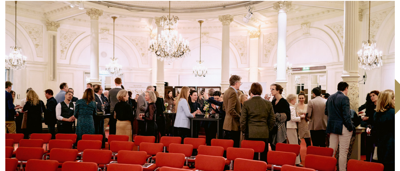
Ontvangst van business club De Salon in de Spiegelzaal voorafgaand aan een concert in de serie Essentials

“Als het goed gaat met je bedrijf of privé, vind ik dat je verplicht bent om te delen. Dat verrijkt ook je eigen leven.”