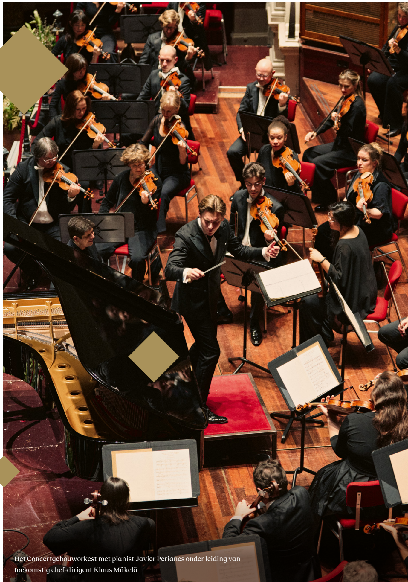
Het Concertgebouworkest met pianist Javier Perianes onder leiding van toekomstig chef-dirigent Klaus Mäkelä