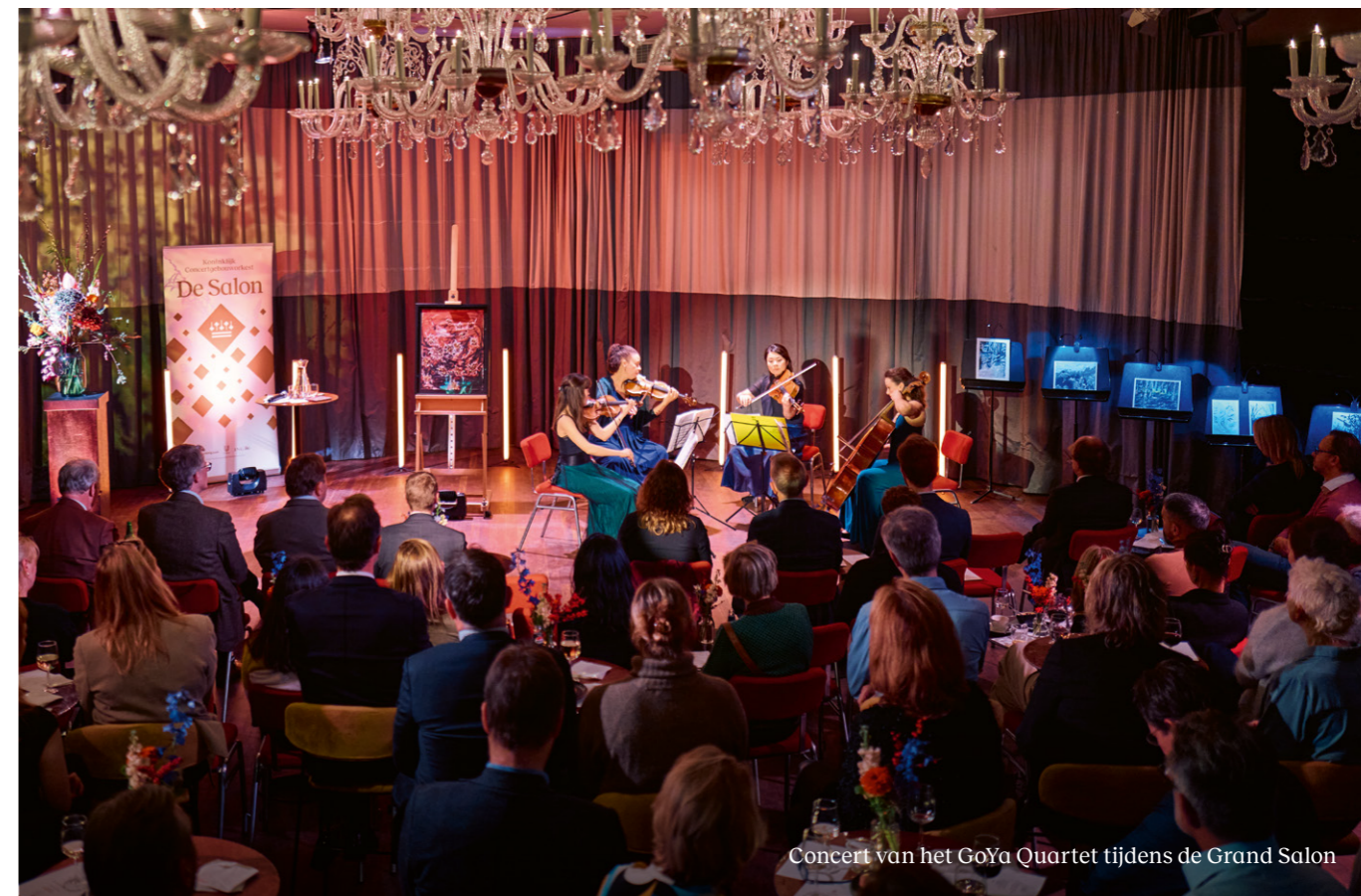
Concert van het GoYa Quartet tijdens de Grand Salon