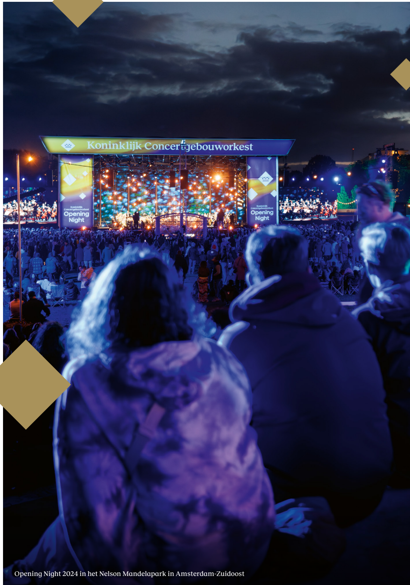
Opening Night 2024 in het Nelson Mandelapark in Amsterdam-Zuidoost