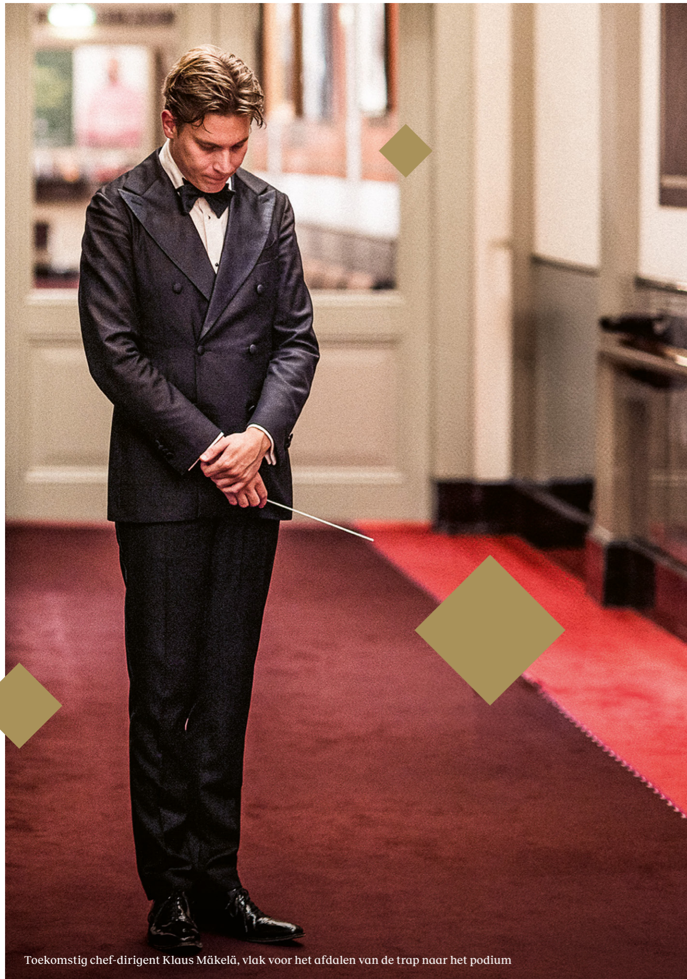
Toekomstig chef-dirigent Klaus Mäkelä, vlak voor het afdalen van de trap naar het podium