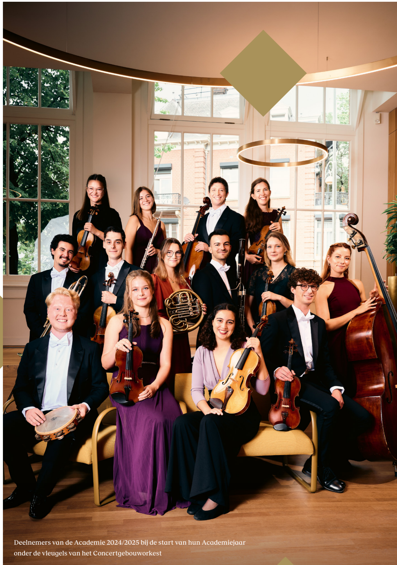
Deelnemers van de Academie 2024/2025 bij de start van hun Academiejaar onder de vleugels van het Concertgebouworkest